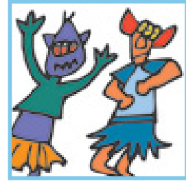
Fiesta de carnaval