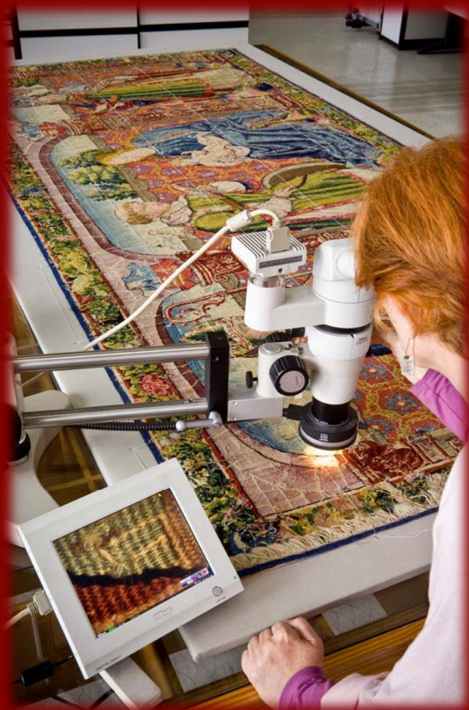
左图：研究所工作人员对挂毯进行修复前的技术分析研究。