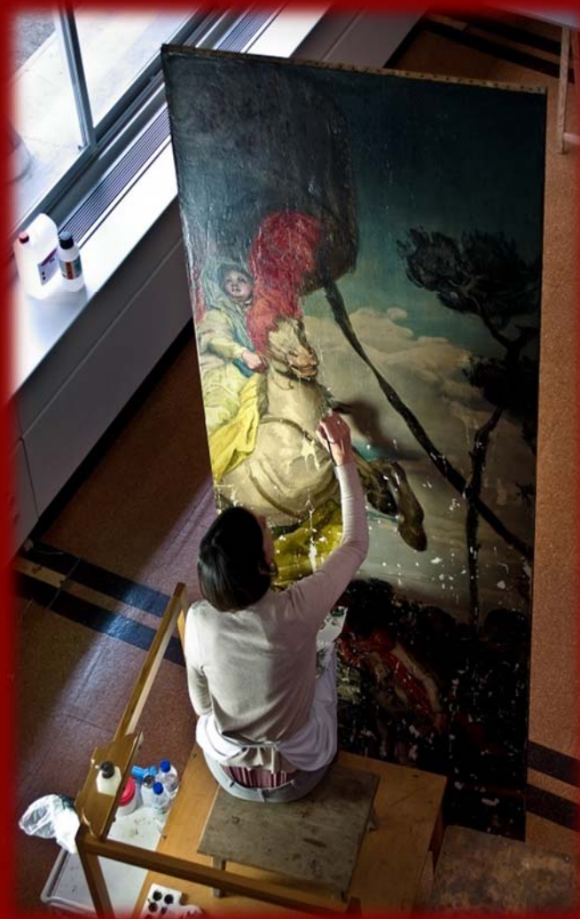
右图：工作人员对著名画作进行修复。