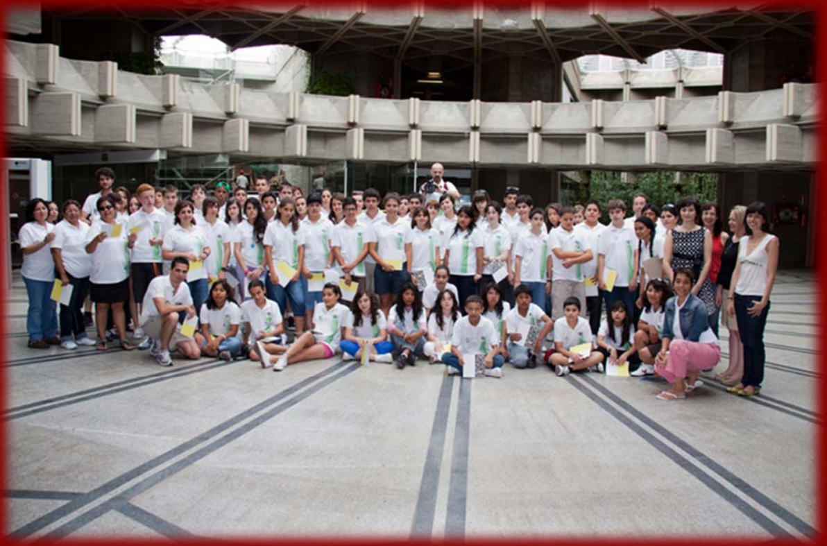
世界各地的学生及学者来 IPCE 研究所参观,交流 , 培训。