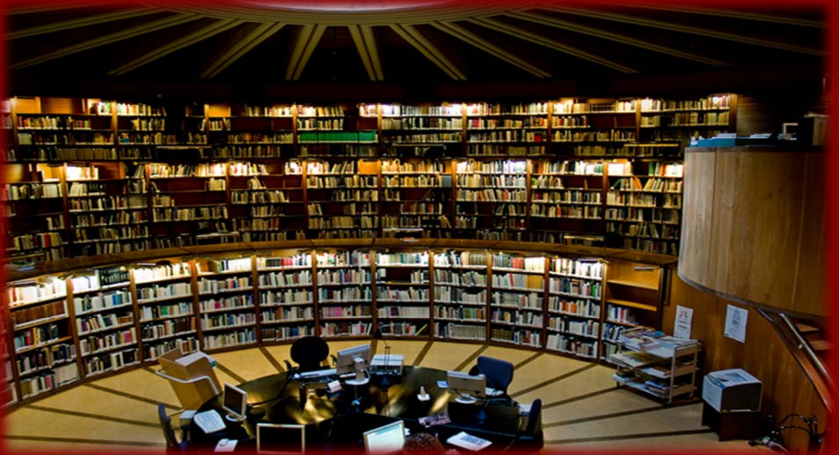
IPCE 研究所图书馆及档案馆